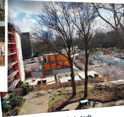
Alles neu in Lokstedt