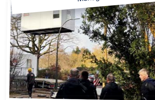
Baucontainer für den Alsterpark