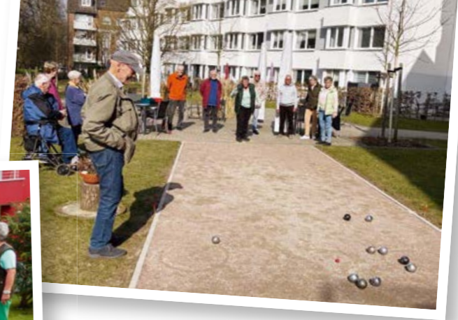
Das neue Freizeitangebot in Langenhorn findet viel Anklang.

„Wir sammeln schon neue Ideen, da liegt noch einiges in der Luft.“