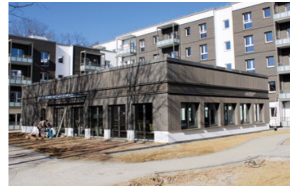
Der Gemeinschaftsraum kann künftig von den neuen Nachbarn als Treffpunkt genutzt werden.