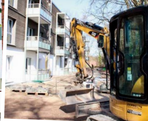
Letzte Arbeiten in Rahlstedt