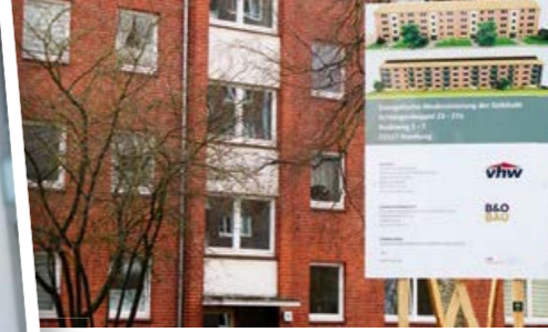
Modernisierung in Öjendorf