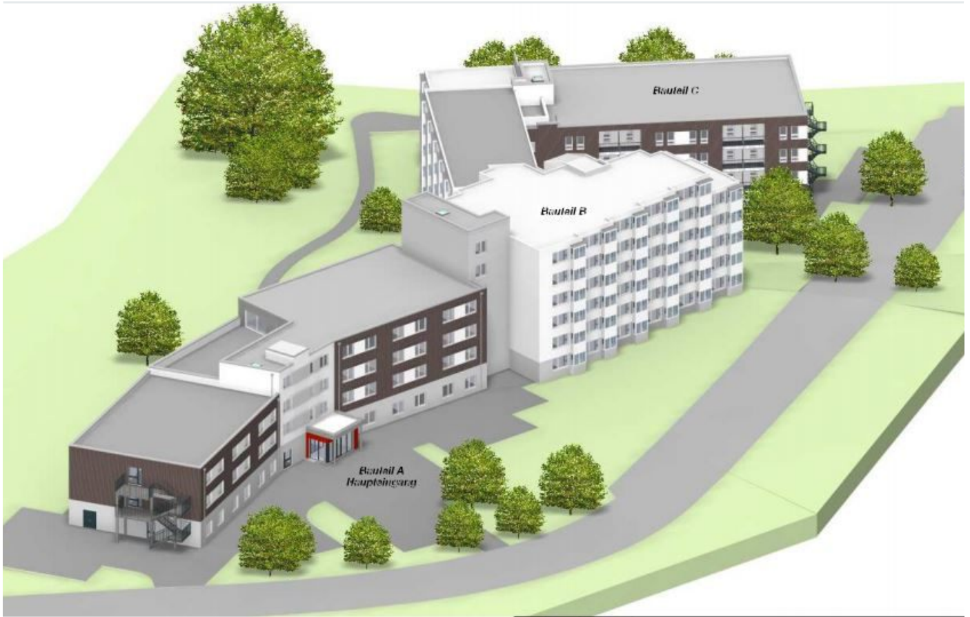
Aussenansicht SWA Langenhorn.JPG